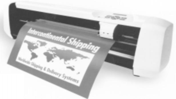
Abb.: 1 Summa D60 Schneideplotter

Ein neuer Standardplotter in der 60cm Klasse zu einem attraktiven Preis und mit vergleichsweise hoher Ausstattung.