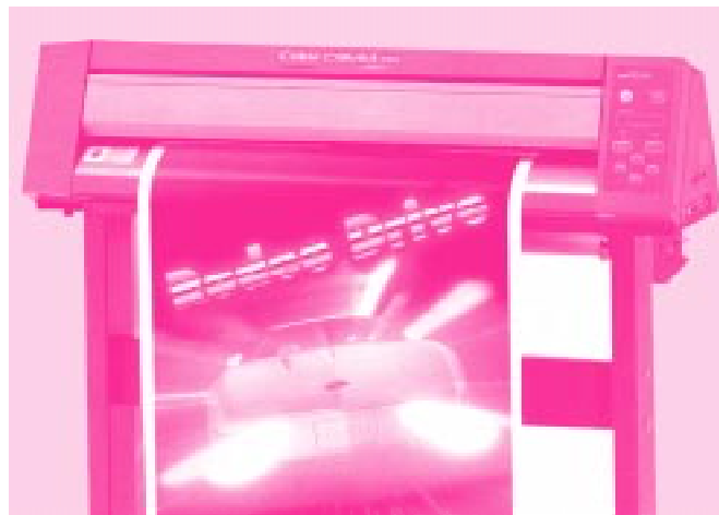
Abb. 2: Roland PC-60 - „Print & Cut“-Plotter mit Thermotransfer-Technologie

„Lebendige Farben fesseln den Blick des Betrachters“. Mit dieser richtigen Feststellung beschreibt Roland die Vorteile des Einsatzes von Farbdruck in der Werbung. Roland hat die ColorCAMM Serie erweitert und bietet mit dem Pro PC-60 ein stark verbessertes Gerät an. Der Pro PC-60 verarbeitet Folienbreiten von 50-610mm. Die max. Arbeitsfläche ist 571mm x 25m. Die Druckauflösung ist mit 600dpi für hochwertige Drucke geeignet. Das Thermotransferverfahren mit Harzbändern gewährleistet sehr hohe Abriebfestigkeit und eine UV-Beständigkeit zwischen 2 und 3 Jahren. Prinzipiell bedruckbar sind alle für den Siebdruck und Textildruck geeigneten Folientypen. Die Speicherkapazität ist 2MB RAM (erweiterbar). Eine spezielle Versatztechnologie verhindert Streifenbildung (Banding).