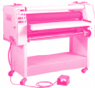
Abb. 1: Image 400er Serie von Seal

Das Lieferprogramm umfaßt insgesamt 6 verschiedene Modelle, je nach Anwendung.