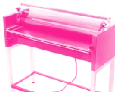
Abb. 2: Weiss-Laminator

Interessenten wenden sich bitte an unseren Vertrieb.