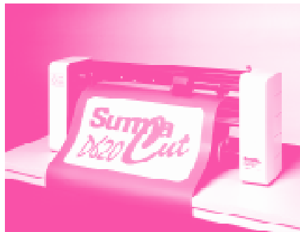
Abb.: 2 - SummaCut D620 - Tischgerät

* Solange der Vorrat reicht. Alle Preise verstehen sich rein netto zzgl. 16% MwSt und Versandkosten. Angebot gültig bis 30.07.98.