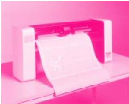
Abb.: 1 - SummaCut D520 - Tischgerät

* Solange der Vorrat reicht. Alle Preise verstehen sich rein netto zzgl. 16% MwSt und Versandkosten. Angebot gültig bis 30.07.98.