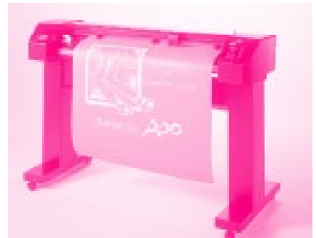
Abb.: 3 - SummaSign T1300 - mit Standfuß