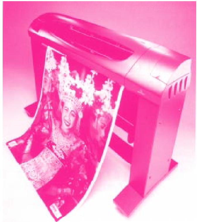
Abb.: 1: CrystalJet - Interessante Neuentwicklung von CalComp

Der empfohlene VK-Preis für den CrystalJet 42 liegt bei 45.000 DM und für den breiteren CrystalJet 54 bei 63.000 DM.